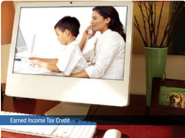
Earned Income Tax Credit