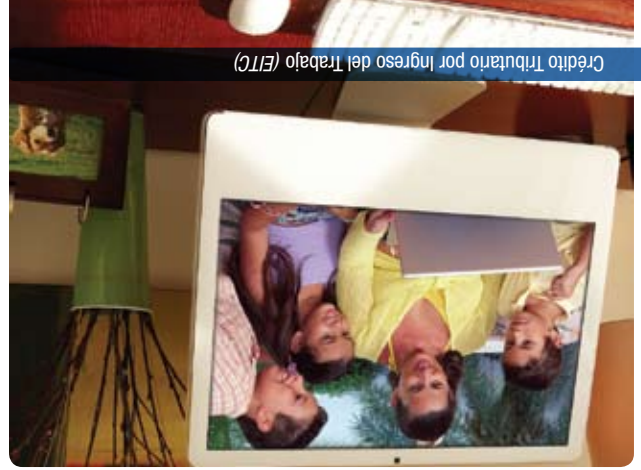
Crédito Tributario por Ingreso del Trabajo (EITC)